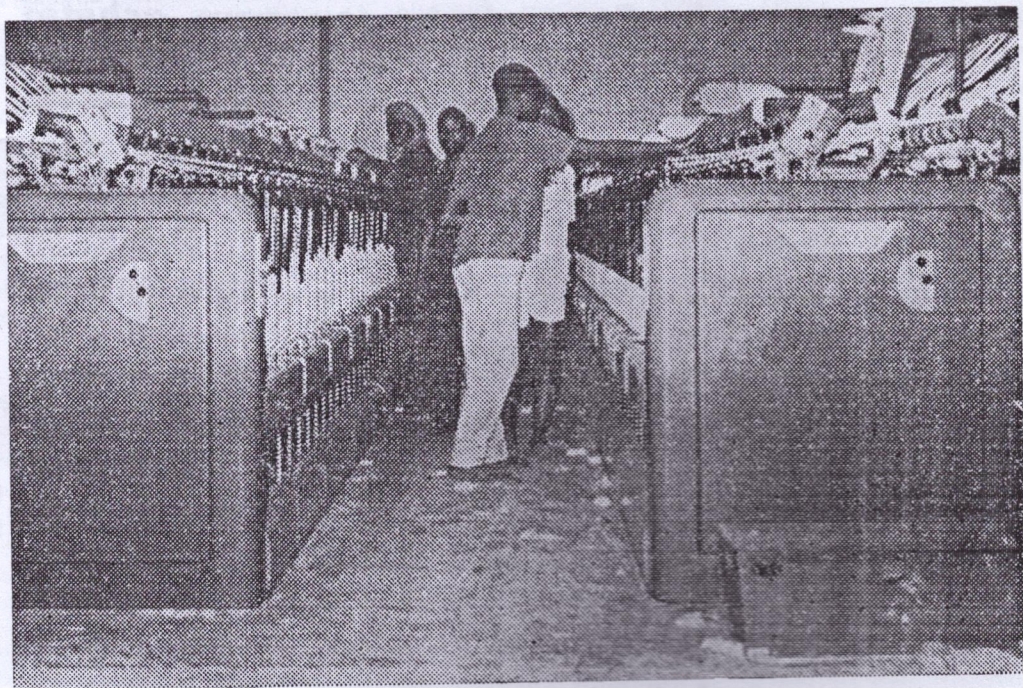
Sur notre photo : l'Usine textile de Sanoya — la section de filature.